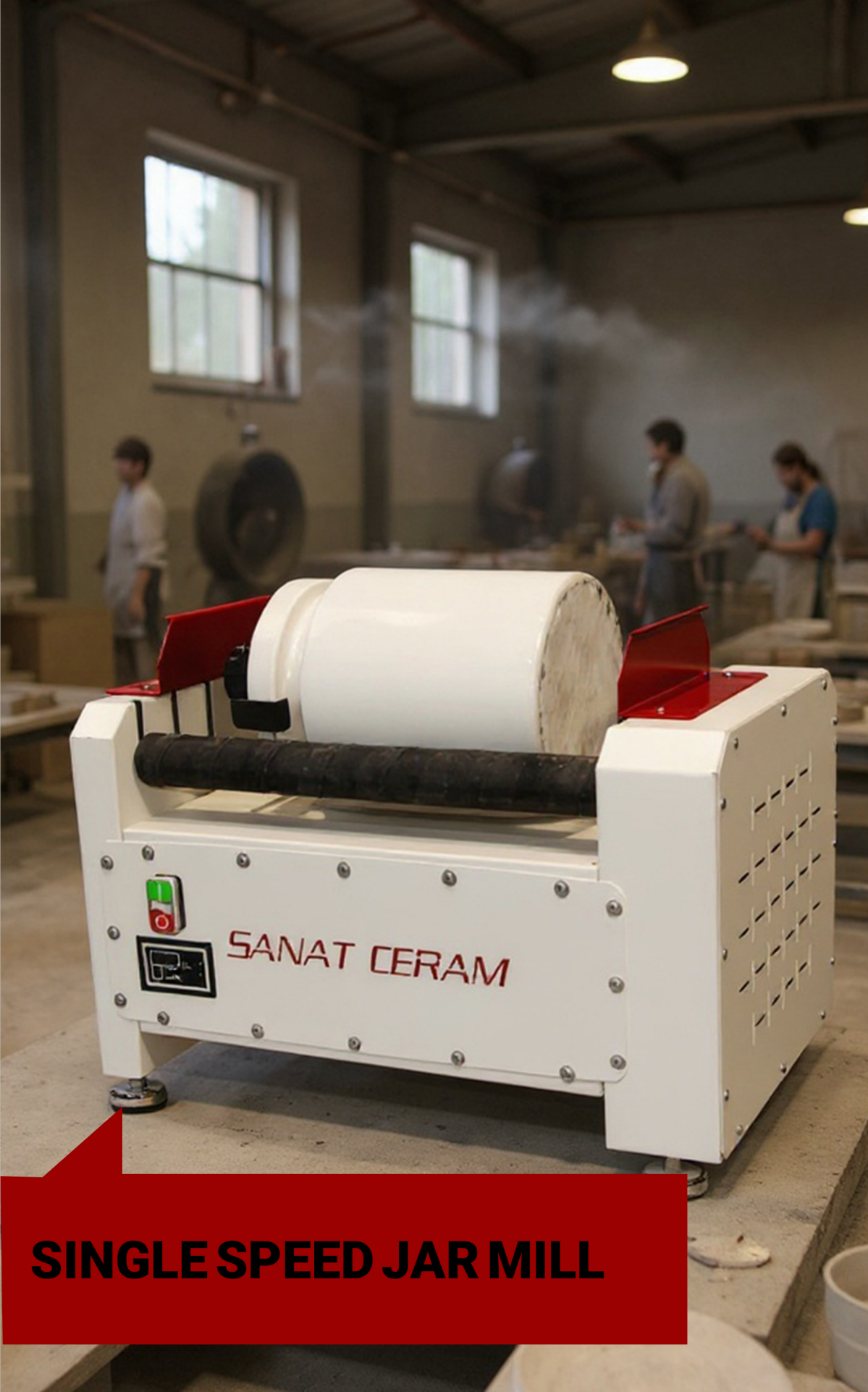
SINGLE SPEED JAR MILL